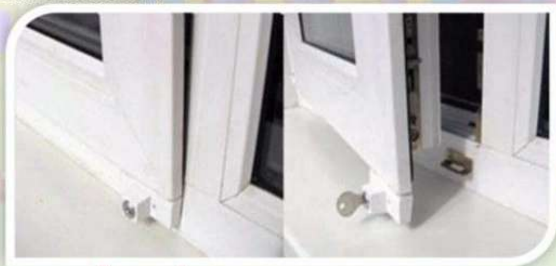
Замок блокировщик с ключом

Можно воспользоваться специальными замками блокираторами, которые предлагают установщики пластиковых окон.